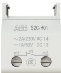
2CDS200970R0031 S2C-H01 Integrierter Hilfsschalter 1 Öffner