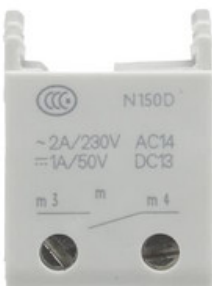
2CDS200970R0032 S2C-H10 Integrierter Hilfsschalter 1 Schließer