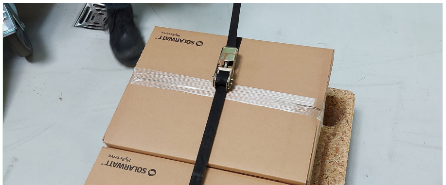
Alternative: Über Kreuz fest fixieren mit Transportgurten Alternative: Fix crosswise with transport straps