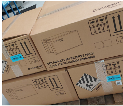
Kartons überlappend stapeln Stack boxes overlapping