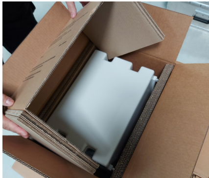
Abdeckung einfügen Insert cover