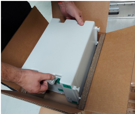
MyReserve Pack einlegen Place MyReserve Pack