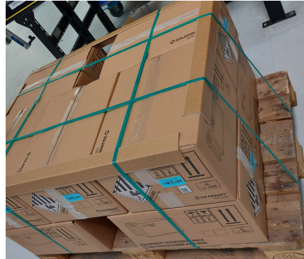
über Kreuz fest fixieren Fix crosswise