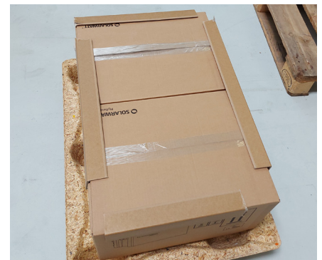
Bündig ausrichten Kanten verstärken Align flush Protect box edges