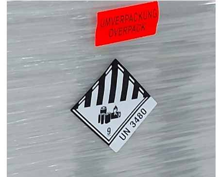
Umverpackung grundsätzlich kennzeichnen Always label outer packaging