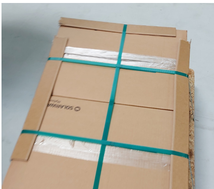
Über Kreuz fest fixieren Fix crosswise