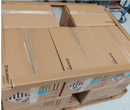
Kanten verstärken Protect box edges