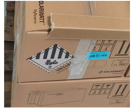
Gefahrgutkennzeichen sichtbar positionieren Position hazardous goods labels visibly