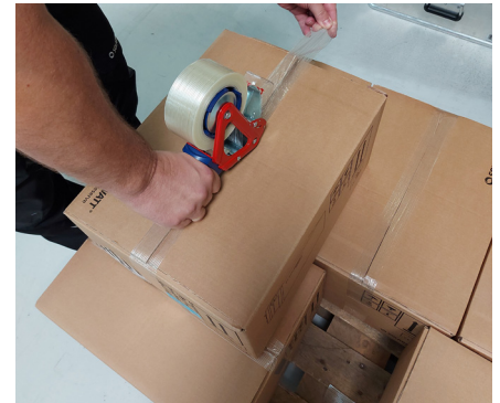
Karton verschließen Close cardboard box