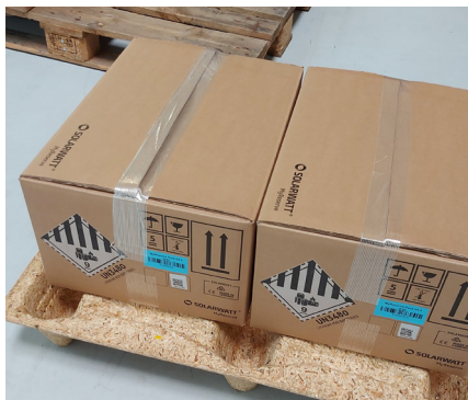
Gefahrgutkennzeichen sichtbar positionieren Position hazardous goods labels visibly