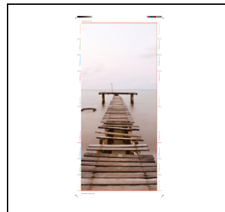
UZ642DP10 Design Folie Holz EAN Art.-Nr. 2CPX031792R9999 Listenpreis 459,00 €