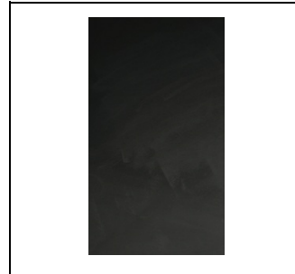
UZ640DP10 Memory board Folie EAN Art.-Nr. 2CPX031790R9999 Listenpreis 459,00 €