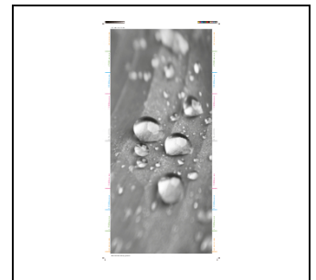
UZ643D Design Folie Tropfen EAN Art.-Nr. 2CPX031789R9999 Listenpreis 48,50 €