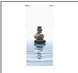
UZ641DP10 Design Folie Stein EAN Art.-Nr. 2CPX031791R9999 Listenpreis 459,00 €