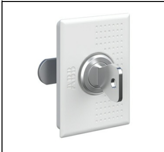
UZT3 Sicherheits-Schloß UK600 EAN Art.-Nr. 2CPX031412R9999 Listenpreis 30,10 €