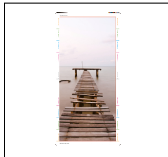
UZ642DP10 Design Folie Holz EAN Art.-Nr. 2CPX031792R9999 Listenpreis 459,00 €