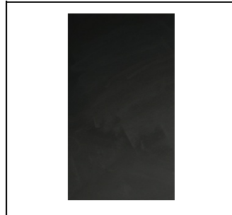
UZ640DP10 Memory board Folie EAN Art.-Nr. 2CPX031790R9999 Listenpreis 459,00 €